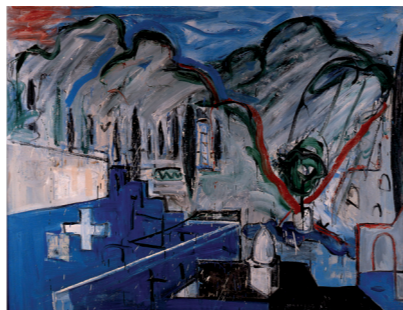
Miguel Ángel CAMPANO Omphalos II (Delphi) 1984 Óleo sobre lienzo

La tercera de las mencionadas exposiciones es Otras Figuras , 7 de la que es comisaria María Corral y que tiene lugar en 1981. La exposición plantea un relato que se centra en la aparición a principios de los setenta de cuatro pintores, que nadando contra corriente,