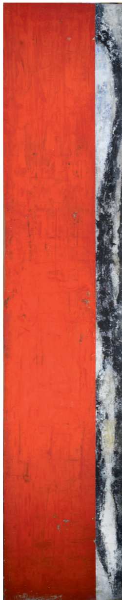
José María SICILIA Fior roja, 1987 Pintura acrílica sobre lienzo