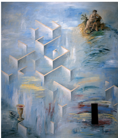
Guillermo Pérez VILLALTA Lugar inquieto 1989 Óleo sobre lienzo

Entre las exposiciones celebradas en España centradas en el conocimiento y promoción del arte español, además de las que tienen