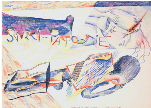
Chema COBO Sweet-side of sweet patootie 1980 Lápiz de color sobre papel

Pese a esos inconvenientes, y de ahí este proyecto expositivo, la pintura es un testigo más de la historia, un protagonista mezclado con la gente, a la búsqueda de la estética y de la ética. Es la aportación personal de un artista en un espacio temporal al que da riqueza y nobleza.