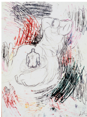
Sandro CHIA Sin título, 1981 Lápiz y lápiz de color sobre papel