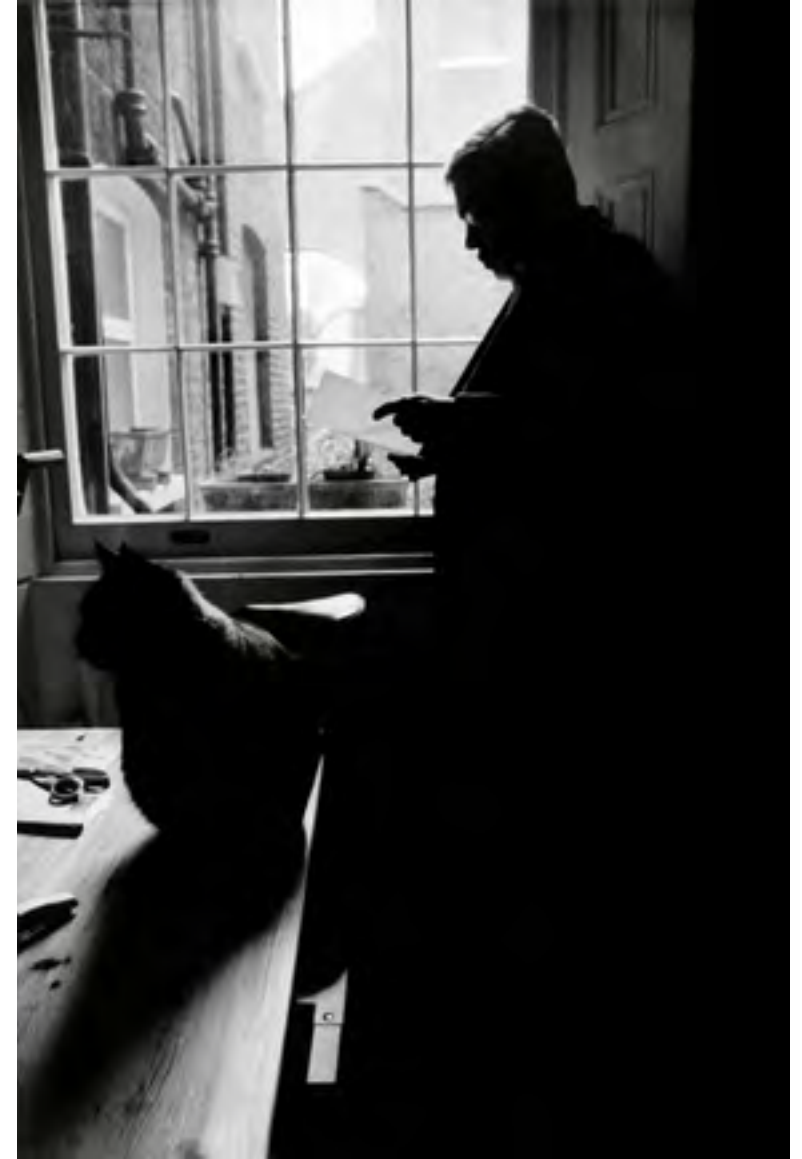
GUILLERMO CABRERA INFANTE Londres, 1998 43