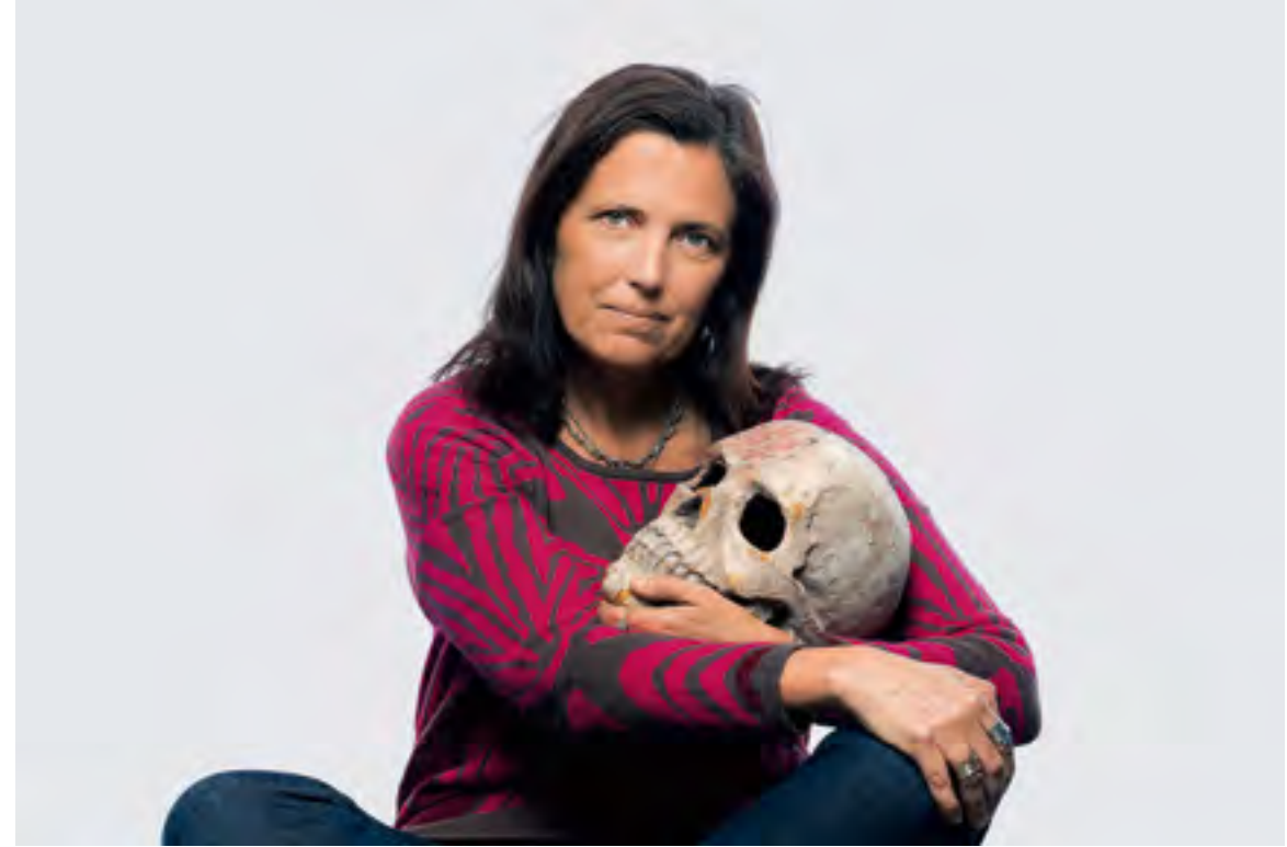
CLAUDIA PIÑEIRO Buenos Aires, 2014 69