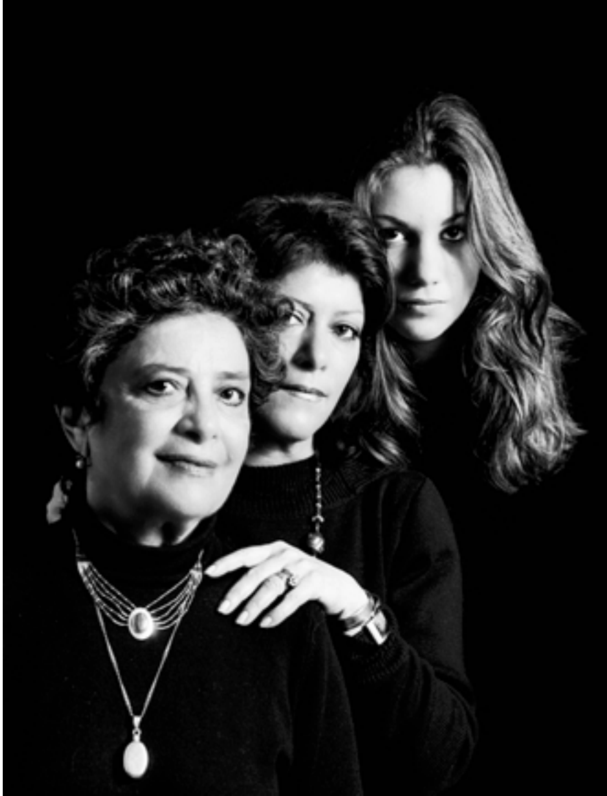
42 CLARIBEL ALEGRÍA París, 1994