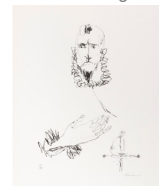
El caballero de la mano en el pecho , litografía, 1974.