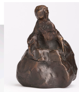
Menina nº1 , bronce, 1974. ↗